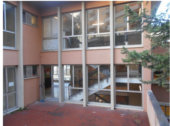
Figura 2.1 - Particolare dei serramenti