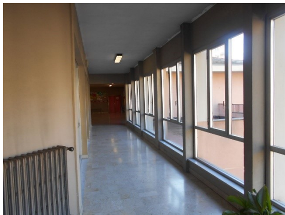
Figura 2.2 - Particolare dei serramenti