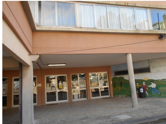
Figura 1.1 - Particolare della facciata principale

L’involucro edilizio opaco che costituisce l’edificio è composto da pannelli prefabbricati in calcestruzzo con uno strato polistirolo interno. La copertura dell’edificio è piana, costituita da blocchi di laterizio più calcestruzzo e materiale impermeabile.