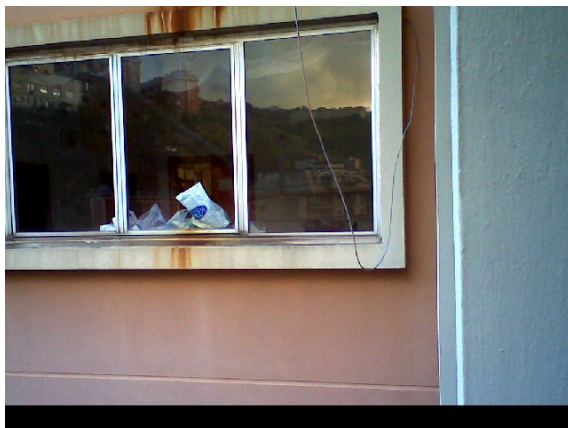
Figura 1.2 – Rilievo termografico della parete