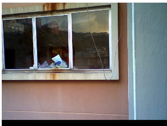
Figura 2.4 – Rilievo termografico dei serramenti